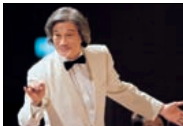
音楽監督 飯守泰次郎 東京シティ・フィル常任指揮者 おおた芸術学校芸術顧問

全員合奏 「日本童謡メドレー」 山本直純編曲 「ラデッキー行進曲」 J.シュトラウスI作曲